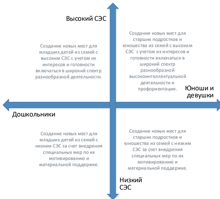
Рис. 5. Шкалы выбора модели создания новых мест по программам художественной направленности с учетом особенностей контингента обучающихся

Вовлечение в программы детей из семей с низким образовательным и культурным уровнем потребует осуществления определенных PR-шагов, поиска мотиваторов для данных детей, в том числе, материальных.