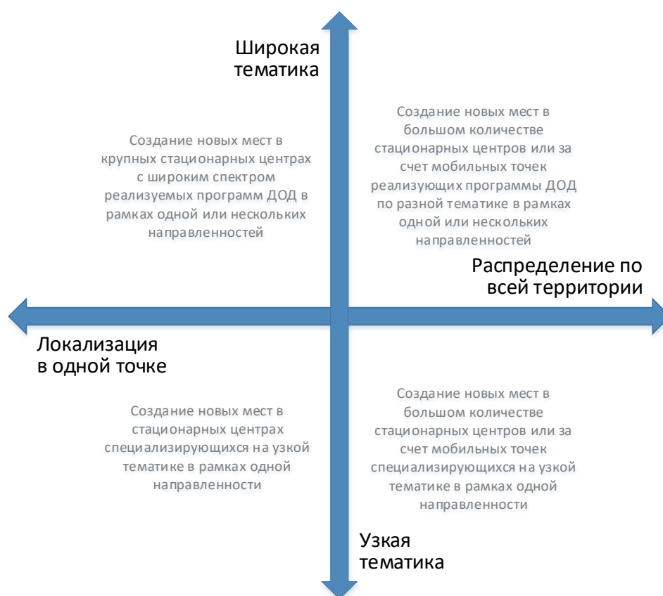
Рис. 3. Шкалы выбора масштаба и формы реализации новых мест по программам ДОД

При невыполнении хотя бы одного из них возникает необходимость пространственного распределения реализуемой модели через мобильные или сетевые решения.