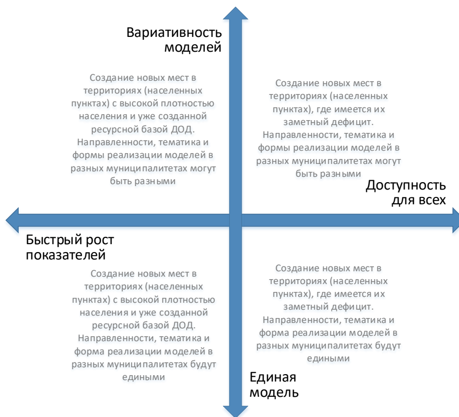
Рис. 4. Шкалы выбора модели создания новых мест с учетом актуальной управленческой политики