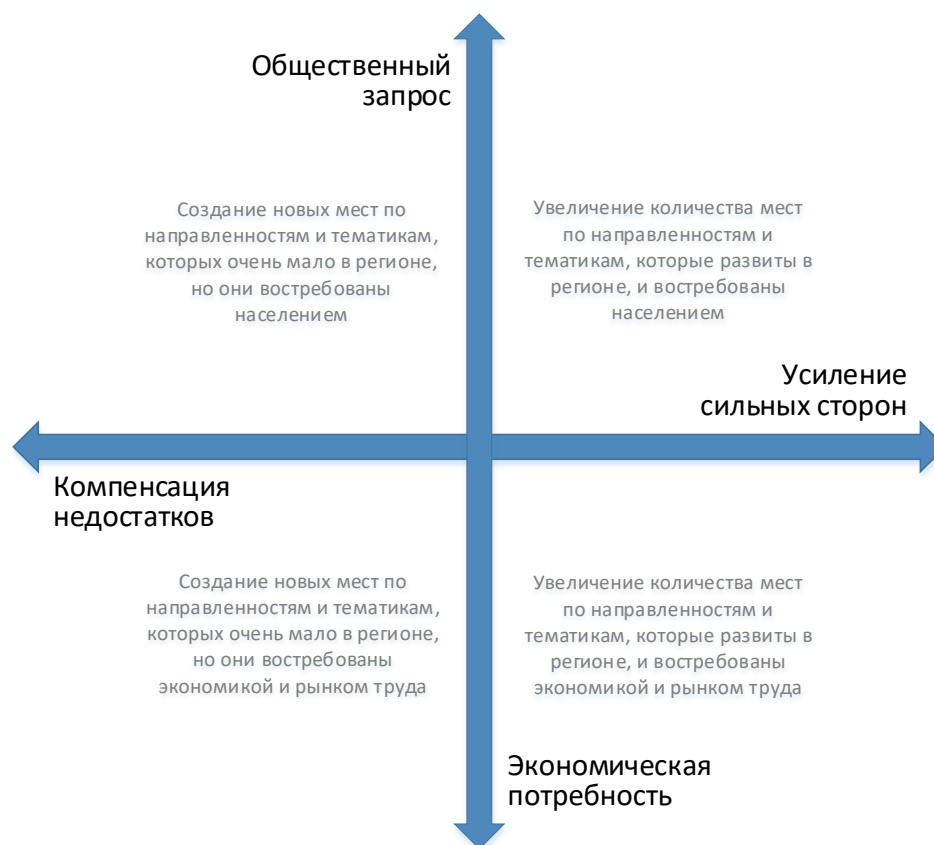
Рис. 2. Шкалы выбора тематики и тактики создания новых мест дополнительного образования