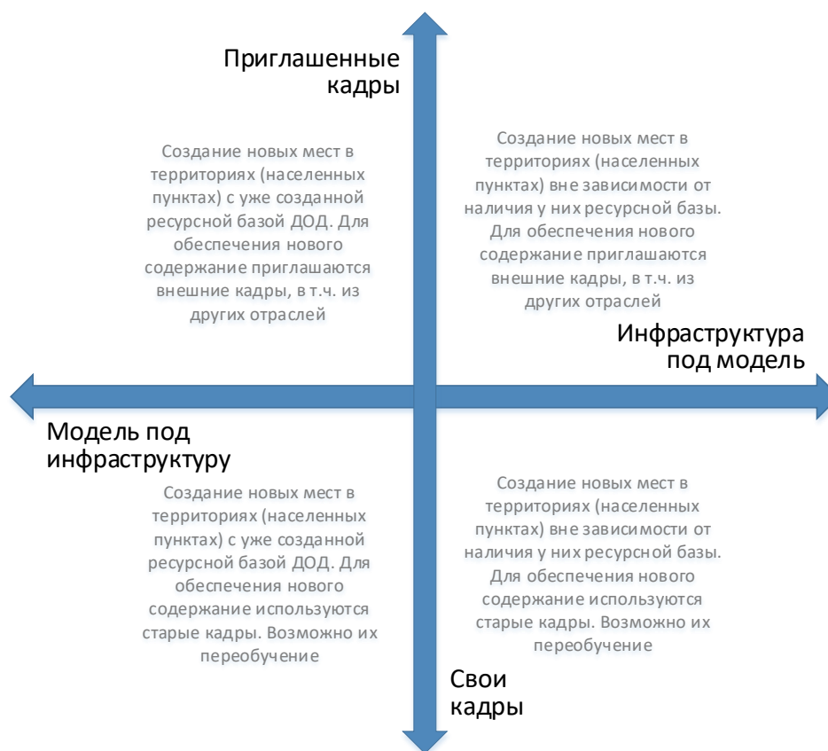
Рис. 6. Шкалы выбора модели инфраструктурного и кадрового обеспечения для типовой модели создания новых мест дополнительного образования

Следует отметить, что механизмы инфраструктурного и кадрового обеспечения не существуют в их полярных вариантах. Решения даже в рамках реализации одной модели будут различны. Анализ перечисленных выше характеристик позволяет сделать эти точечные решения более точными и эффективными.