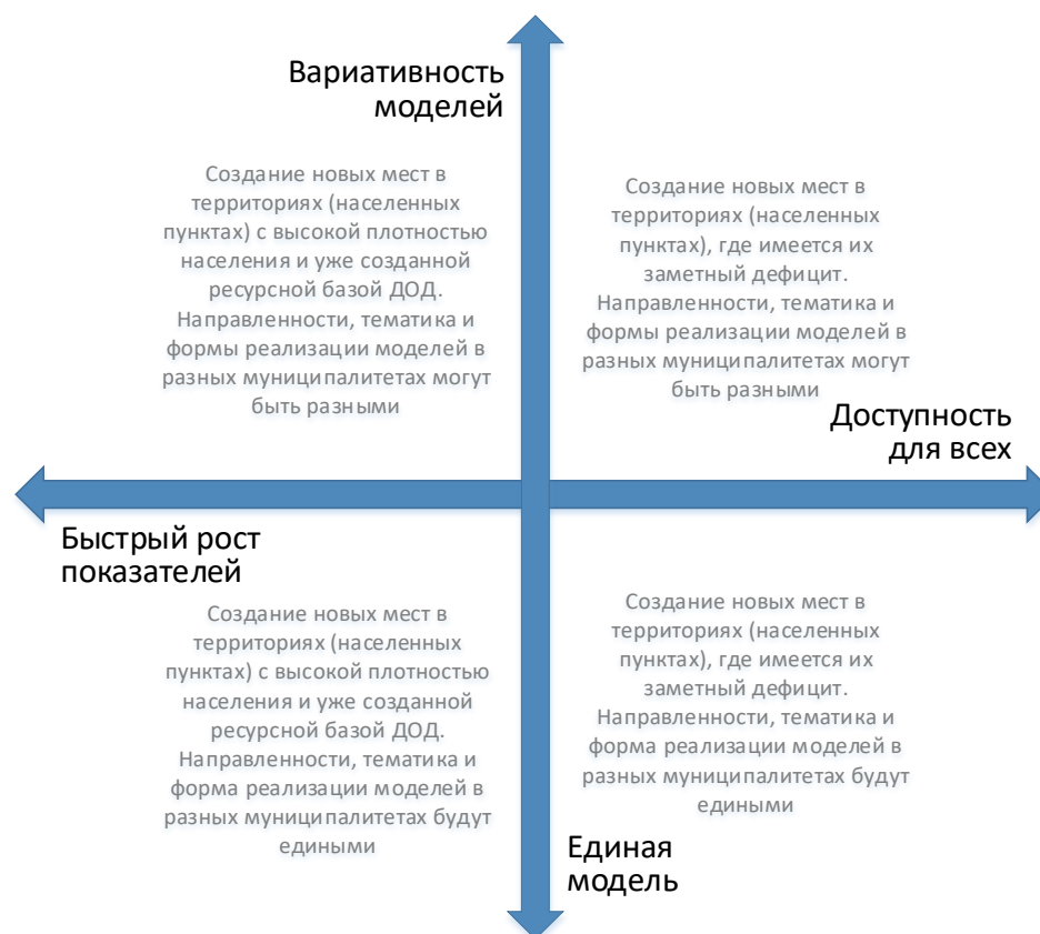
Рис. 4. Шкалы выбора модели создания новых мест с учетом актуальной управленческой политики