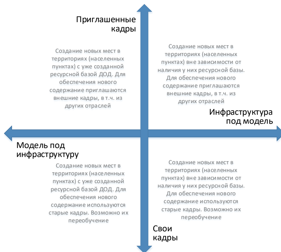
Рис. 6. Шкалы выбора модели инфраструктурного и кадрового обеспечения для типовой модели создания новых мест дополнительного образования

Следует отметить, что механизмы инфраструктурного и кадрового обеспечения не существуют в полярных вариантах. Решения даже в рамках реализации одной модели будут различны. Анализ перечисленных выше характеристик позволяет сделать эти точечные решения более точными и эффективными.