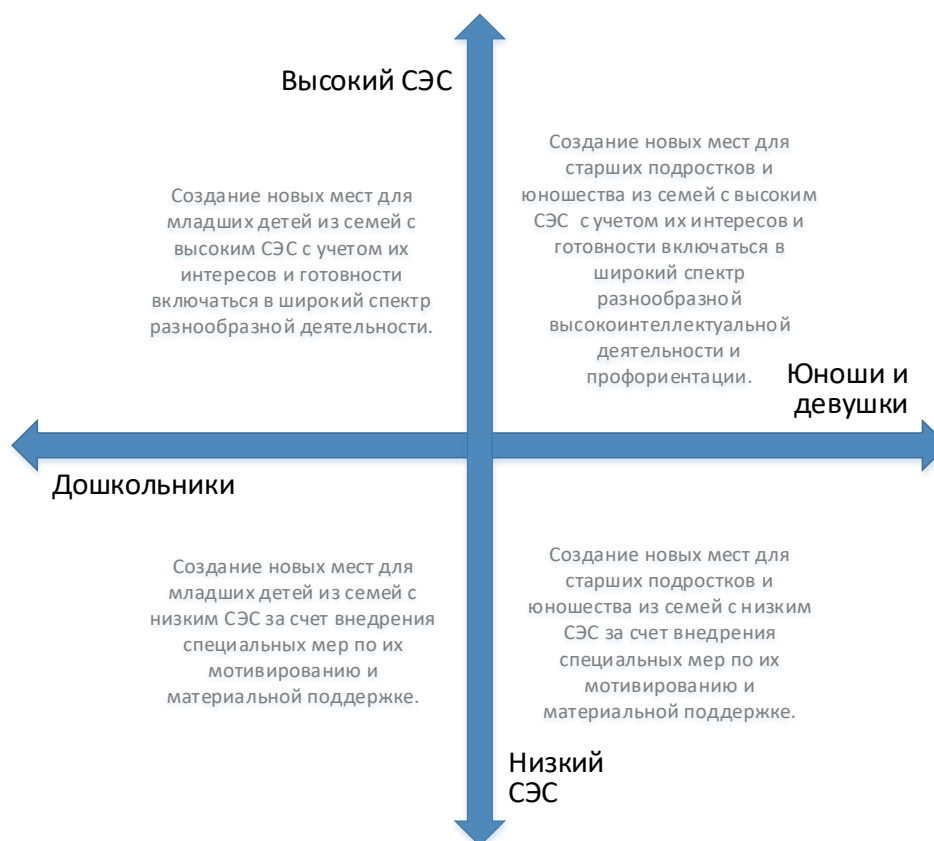
Рис. 5. Шкалы выбора модели создания новых мест по программам технической направленности с учетом особенностей контингента обучающихся

Вовлечение в программы детей из семей с низким образовательным и культурным уровнем потребует осуществления определенных PR-шагов, поиска мотиваторов для данных детей, в том числе материальных.