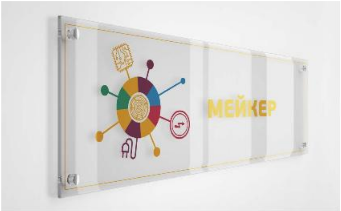
Примеры зонирования и визуализации современных пространств